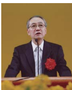
受賞者スピーチの様子

第13回司馬遼太郎賞を受賞した「骸骨ビルの庭」は、贈賞理由として「司馬遼太郎がみつめた近現代史の中で、作品化が及ばなかった戦争が、戦後に残した日陰の部分に視線を向け、文学的に表現したといえる。」と評価された。贈賞式は、故司馬遼太郎氏をしのぶ「第14回菜の花忌」(2010年2月13日)に、東京・日比谷公会堂にて行われた。