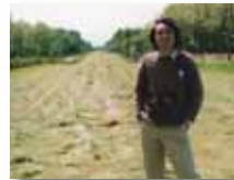
1983年春 北海道早来社台ファームにて「優駿」取材