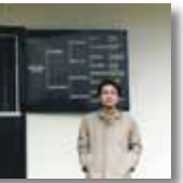
1987年 イギリスニューマーケットにて 有名種牡馬厩舎前