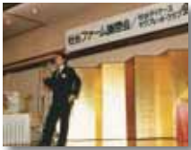
1988年頃 社台ファーム謝辞会会場にて

僕は「泥の河」で太宰治賞、「蜚川」で芥川龍之介賞で出発しました。これはどちらも純文学と呼ばれている世界ですよ。僕は小説に純も不純もないと思っただけです。純文学とか大衆小説とかを意識するということ、は嫌だったんですよ。ところが「優駿」が候補になったというところを知らずしてました。そのときにふつと、「泥の河」「蜚川」で作品が世に出たから10年と少し、「優駿」で吉川英治文学賞をいただいた、まあ要するに純文学の賞も大衆文学とわかれていた分野の賞も頂戴したんだ。これは何か、「宮本」、もう純も不純も大衆も中間小説もどうでもいいじゃないか、おまえの好きなものを書いていけよ」と言ってくれたのかなと、そういう風に自分で考えたんです。それからちょっと自由になりましたね。日本の文壇のジャンルというものを抜けて、好きなものを、つまり何書いても文学だよ、という考えにぱつと転換できましたね。そういう大きい、自分の心構えとしてのエポックのような作品だったと思います。