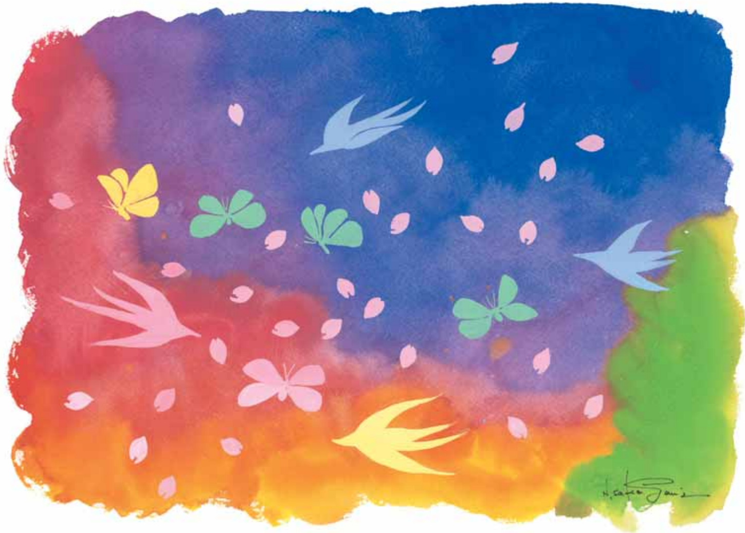
落花随燕入 遊糸帯蝶驚 「約束の冬」(第63回)