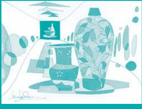
壺 「人間の幸福」(第215回)