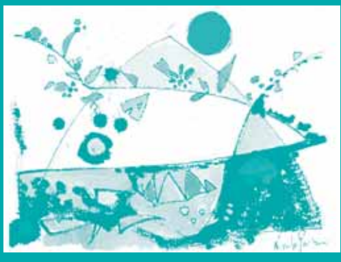
プロローグ 「にぎやかな天地」(第1回)